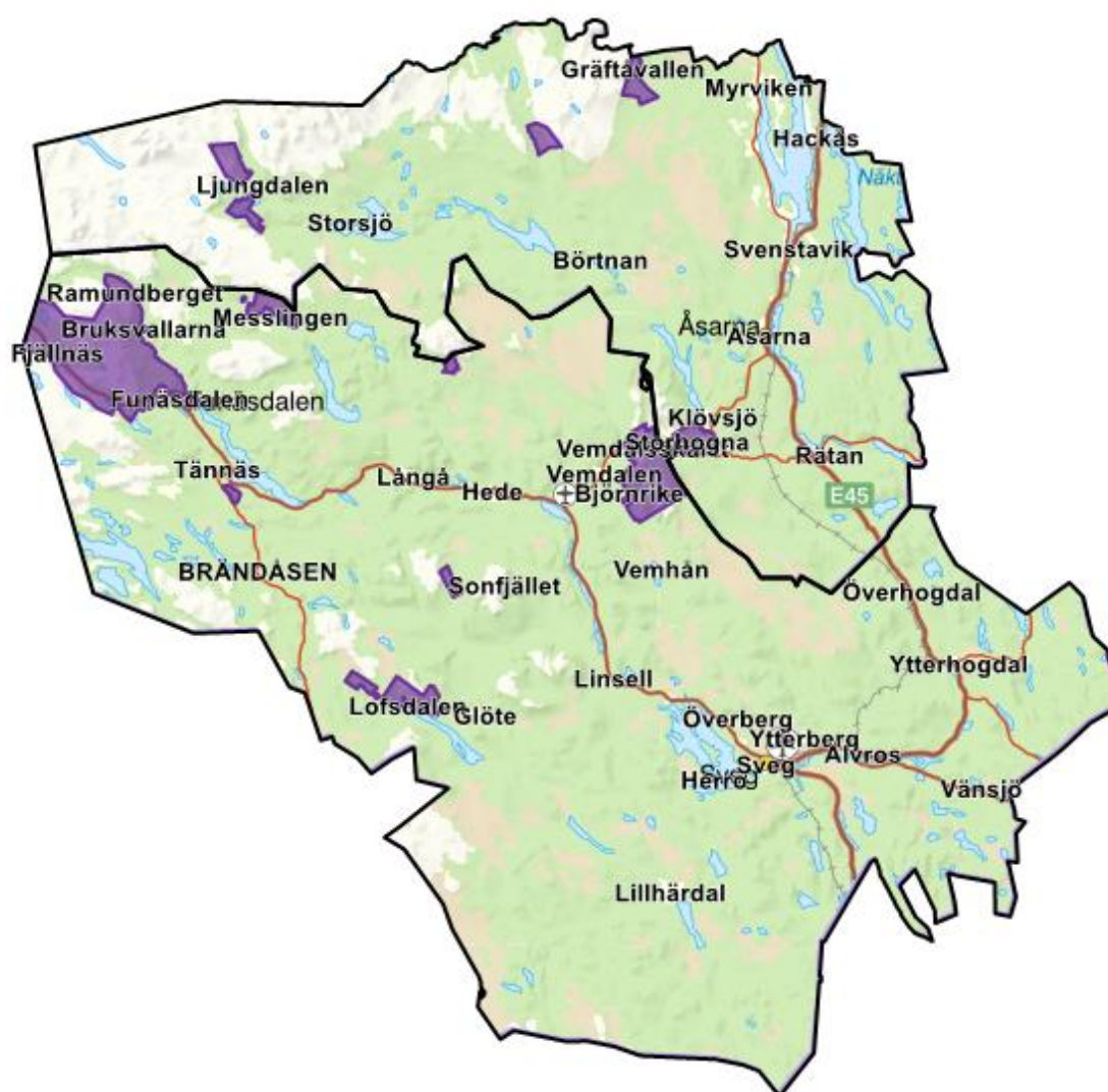
Fig. 1. Hämtområde 2 markerat med lila. Hämtområde 1 är övriga delar av kommunerna.

Fastighet med flerbostadshus, fler än 5 lägenheter, samt verksamheter ska ha enskilda behållare.