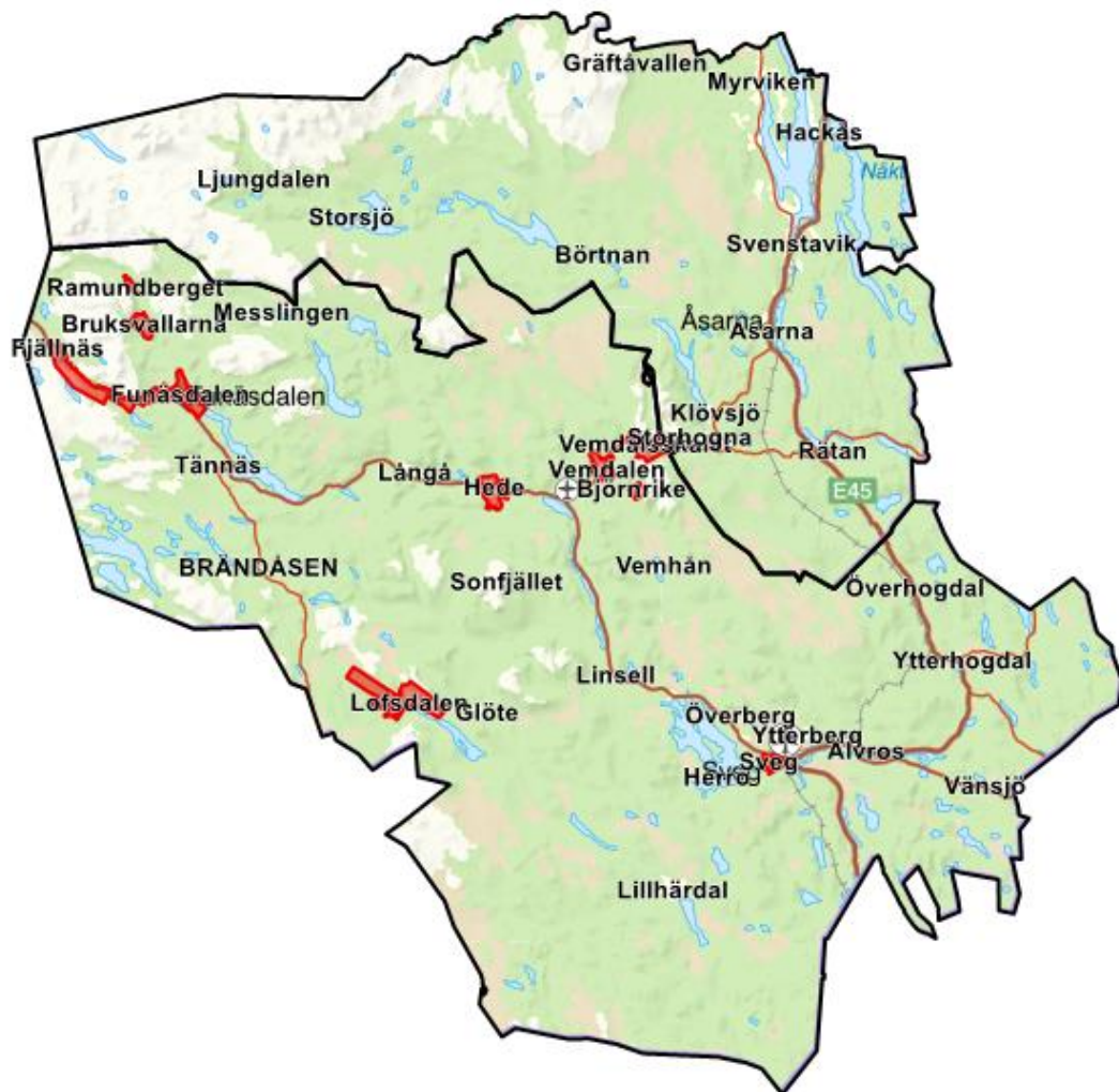
Fig. 2. Teknikområde krantömning markerat med rött.

Tömning med kran erbjuds endast inom rödmarkerade områden, se fig 2.