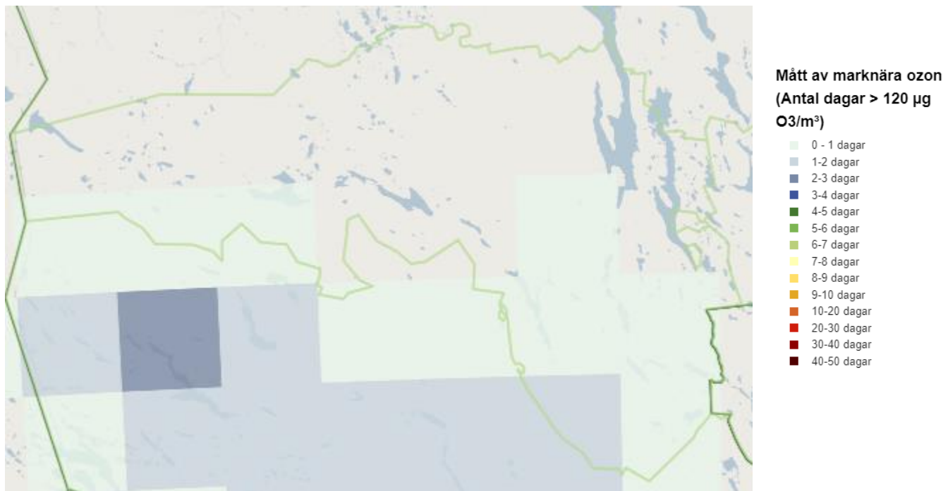
Figur 1. Kartbild från SMHI Miljöövervakning vilken visar över mått av marknära ozon för Bergs kommun 2020.

För området kring Bergs kommun bedöms 120 µg/m 3 ha överskridits vid högst 2 dagar under 2020 som visar det senast uppmätta halterna (figur 1). Under 2019 överskreds 120 µg/m 3 vid högst 6–7 dagar och under 2018 vid högst 1 dag. (SMHI, 2023a).