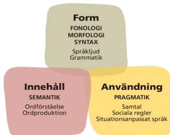
Figur 1. Språkets delar (Eriksson, Habbe, Walther & Westlund, 2015)

Språket kan delas in i tre olika områden – form, innehåll och användning. Varje del är viktig i språkutvecklingen och beskriver både hur barnet förstår och uttrycker talat samt skrivet språk (Eriksson, Habbe, Walther & Westlund, 2015).