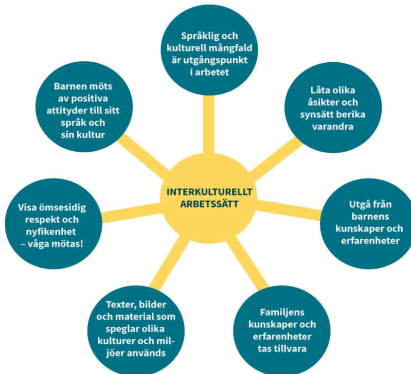
Figur 1. Interkulturellt arbetssätt. (Enskede-Årsta-Vantörs språkprogram, rev.2015)

En språklig och kulturell mångfald ska vara en utgångspunkt för arbetet i en högkvalitativ förskola. Att mötas, lyssna till och lära av varandra är några förutsättningar för ett interkulturellt förhållningssätt mellan förskolan och hemmet. Att visa ömsesidig respekt och nyfikenhet likaså. Förskolan är viktig för alla barn och att gå i en högkvalitativ förskola ger en bra grund för en positiv kunskaps- och personlighetsutveckling (Cummins, 2017; Lahdenperä, 2004; Skans, 2011).