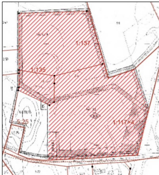
Figur 2 Bild över användningsområde som ändras.

Berg- och Härjedalens miljö- och byggnämnd