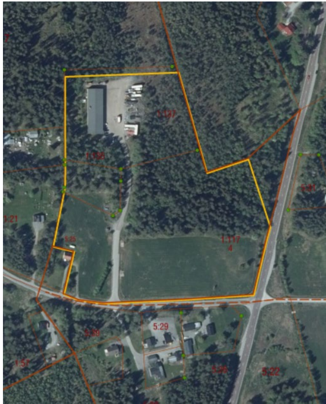
Figur 1 Bild över planområdet.

Berg- och Härjedalens miljö- och byggnämnd