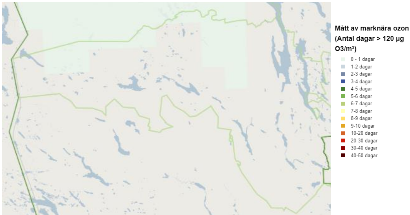
Figur 1. Kartbild från SMHI Miljöövervakning vilken visar över mått av marknära ozon för Bergs kommun 2022.

För området kring Bergs kommun bedöms 120 µg/m 3 ha överskridits vid högst 1 dag under 2022 (figur 1) samt vid högst 2 dagar under 2020. Under 2019 överskreds 120 µg/m 3 vid högst 6–7 dagar och under 2018 vid högst 1 dag. (SMHI, 2024a).